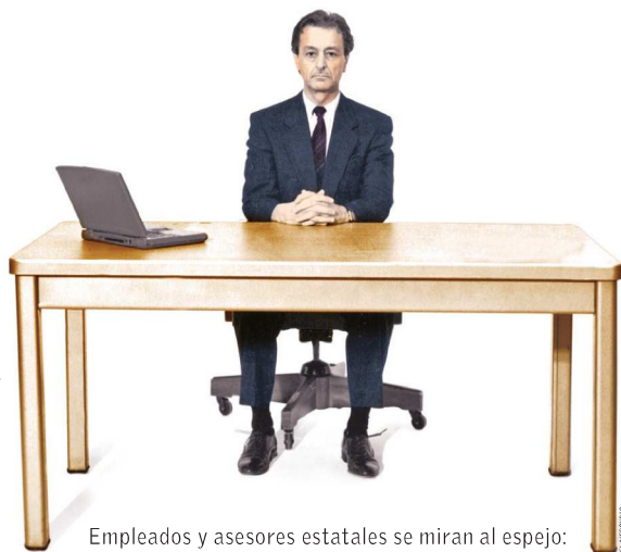
Empleados y asesores estatales se miran al espejo:

8% apenas afirma que los municipios están preparados para cumplir con sus funciones.